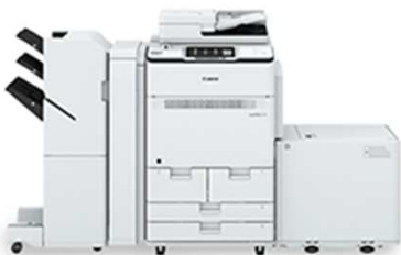
Image PRESS C265 プロダクション機